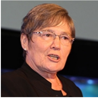
Clare Short Presidenta de la Junta de Gestión de la Alianza de las Ciudades