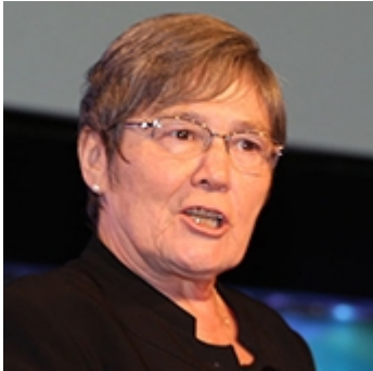
Clare Short Presidenta de la Junta de Gestión de la Alianza de las Ciudades