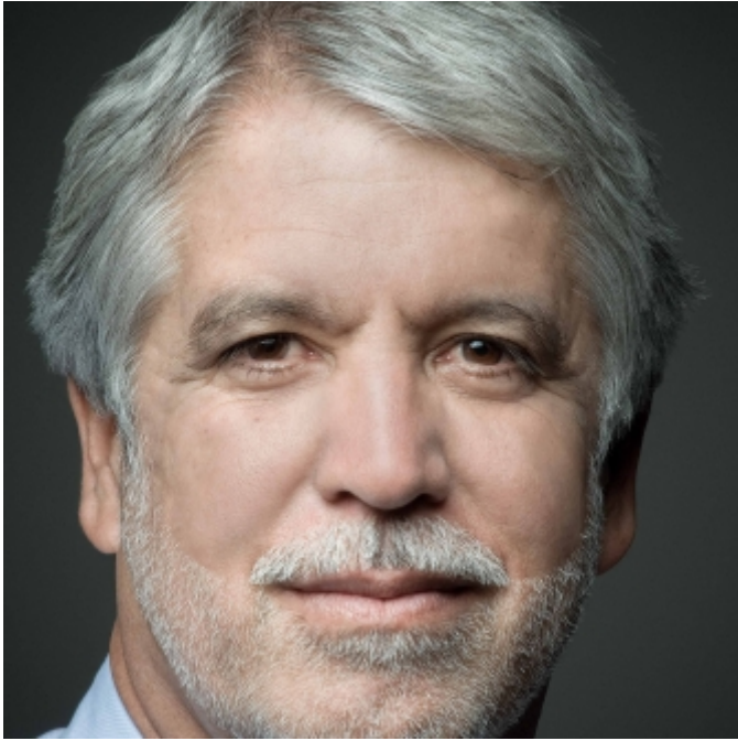
Enrique Peñalosa Londoño Maire de Bogotá