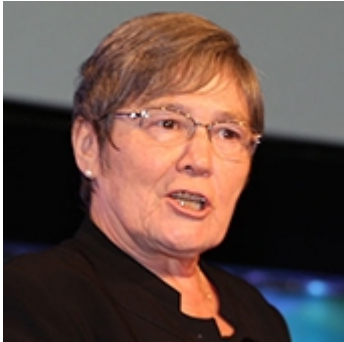
Clare Short Présidente du Bureau de Cities Alliance