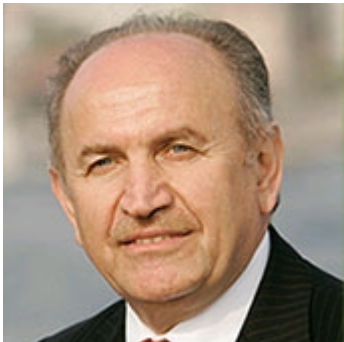
Kadir Topbaş President of UCLG, Mayor of Istanbul