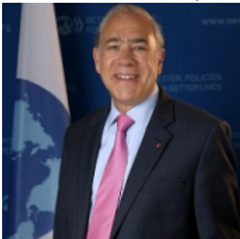
Ángel Gurría Secrétaire Général, OCDE