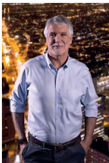
ENRIQUE PEÑALOSA LONDOÑO